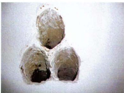
II. 44-50. Wnętrza schronu: drzwi prowadzące z klatki schodowej na korytarz, odkrywki w stropie nad schronem, urządzenia wentylacyjne, wyłaz ewakuacyjny, otwory wentylacyjne 2014.